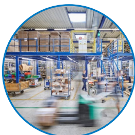
zásilky na míru a just-in-time