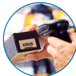
zákaznické čárové kódy