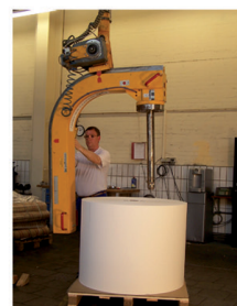
5. vysunutí adaptéru