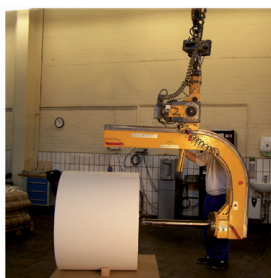
1. nastavení polohy