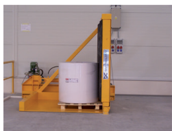
1. role ve vertikální poloze