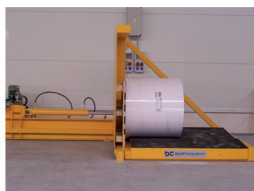
3. role v horizontální poloze