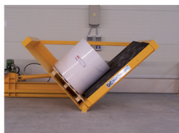
2. naklápění role o 90°