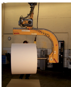
2. vložení adaptéru