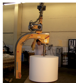
4. uložení v nové poloze