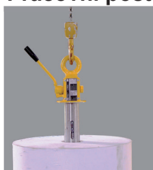
1. nastavení polohy