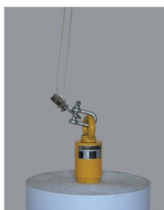
3. automatické upnutí na povoleném laně