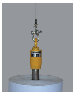
2. vložení adaptéru