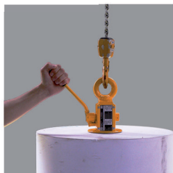
2. ruční upnutí