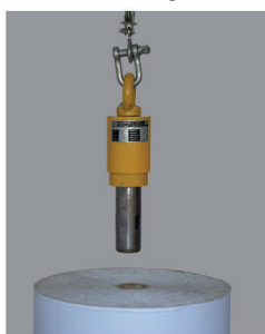
1. nastavení polohy