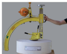
2. vložení adaptéru