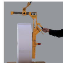
5. uložení v nové poloze