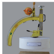
3. zvednutí (upnutí se provede automaticky)