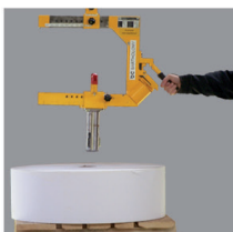
1. nastavení polohy