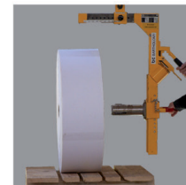
6. vysunutí adaptéru