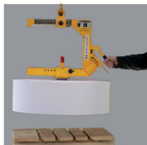
3. zvednutí (upnutí se provede automaticky)