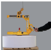
2. vložení adaptéru