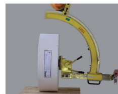
5. uložení v nové poloze