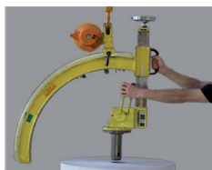
1. nastavení polohy